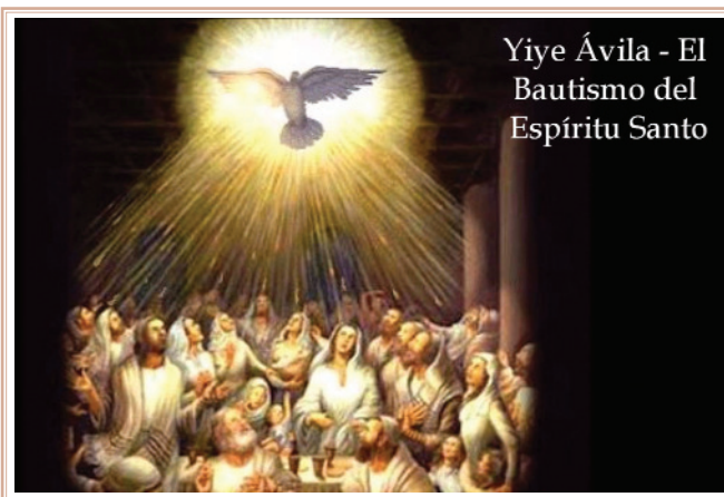
Yiye Ávila - El Bautismo del Espíritu Santo