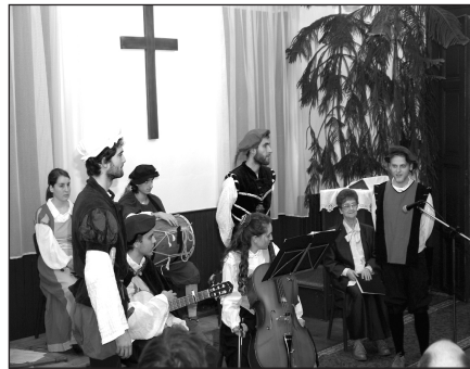
November 24-én ismét megrendeztük az Irodalmi Kávéházat. A Reneszánsz Esten a Viandante Régizene Együttes 500 évvel ezelőtti gyönyörű zenét játszott.

1989-ben. Ez lett a csírája az újjáalakult KIE mai napig is legerősebb munkaágának, a munkatárs- és vezetőképzésnek. Néhány helyi csoport megalakulása után, 1991-ben a Nemzeti Szövetség is megszerveződött. Két fő feladatot vállalt: a helyi ifjúsági munka segítése, csoportszervezés és fejlesztés által és a négyes program szellemében, a különböző programformák bemutatása, a képzések megszervezésével. Kiépültek nemzetközi kapcsolataink is, tőlünk keletre és nyugatra. Kiemelt