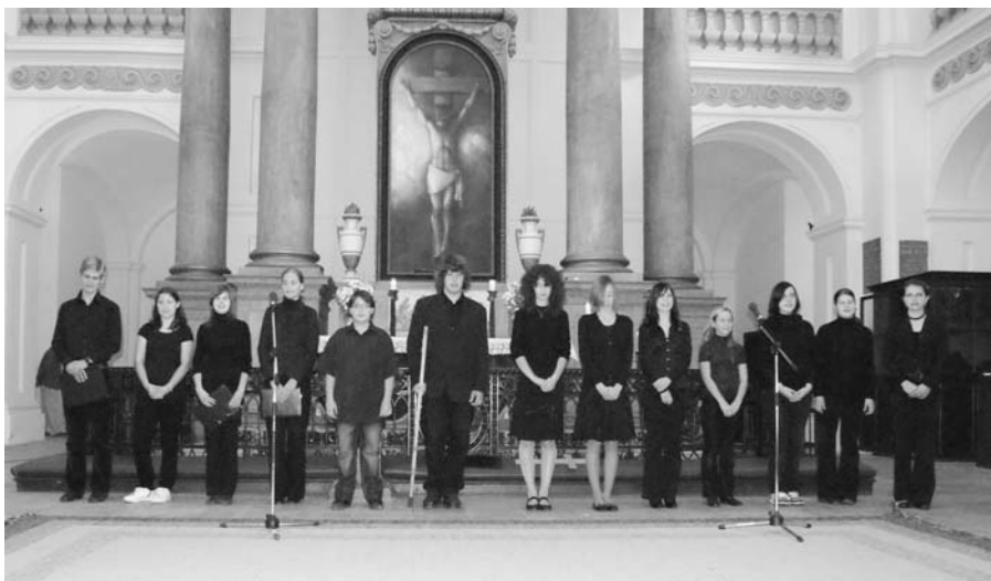
A gimnáziumban a hagyományoknak megfelelően idén is ünnepi műsorral emlékeztek meg a 160 éve kivégzett 13 aradi vértanúról.