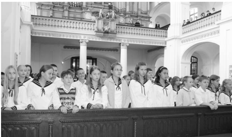
2009. szeptember 1-jén 59 ötödik osztályos és 151 kilencedikes diák kezdte meg tanulmányait a gimnáziumban.